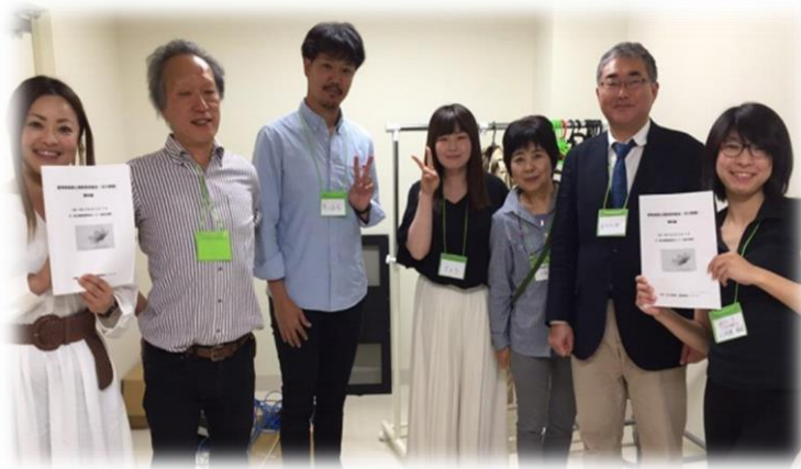
(写真は今年の講師です)